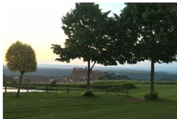
"Le Querce di Bomarzo"