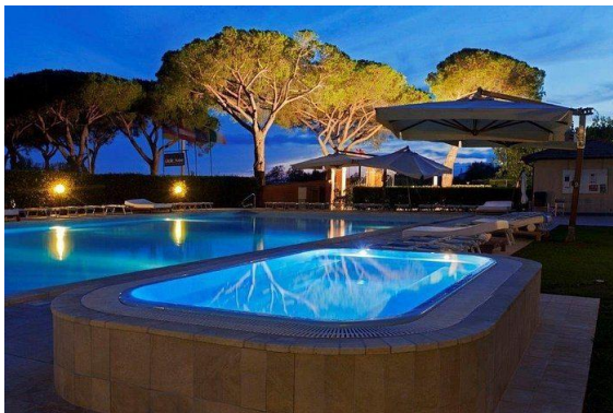
"I Briganti di Capalbio"