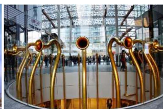
Piazza Gae Aulenti