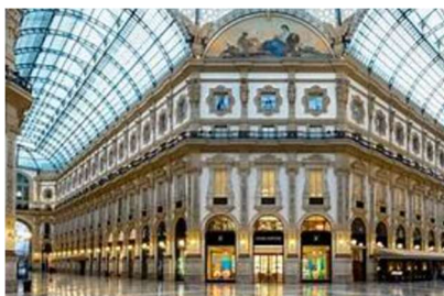
Galleria Vittorio Emanuele

Siamo nel “salotto di Milano”. Da piazza del Duomo andiamo in piazza della Scala, al cui centro c'è la statua di Leonardo da Vinci che guarda il Teatro e volta le spalle a Palazzo Marino, il Municipio di Milano. In Galleria prendiamo il caffè da Savini, il bar più esclusivo di Milano