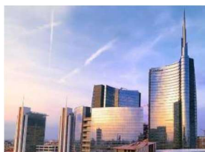
Centro Direzionale e Torre Unicredit

Si prende la metropolitana e si fa visita al Nuovo Centro Direzionale, di Piazza Gae Aulenti, Torre Unicredit e Bosco Verticale.