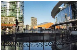
Piazza Gae Aulenti