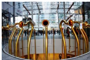
Piazza Gae Aulenti