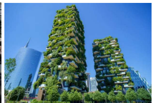
Bosco Verticale e Torre Unicredit