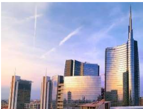
Centro Direzionale e Torre Unicredit

Se il gruppo si muove veloce e rimanesse del tempo, si può aggiungere la visita al Nuovo Centro Direzionale, Piazza Gae Aulenti, Torre Unicredit e Bosco Verticale. Ci si reca con la M5 (viola) e si prosegue a piedi - o con M2 (verde) - alla Stazione Centrale